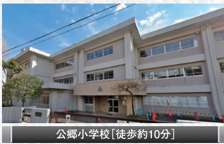
公郷小学校[徒歩約10分]