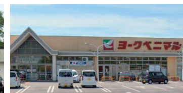
ヨークベニマル [約2,700m]