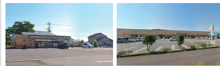
セブンイレブン[徒歩約5分]