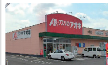
クスリのアオキ【徒歩約3分】