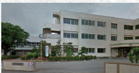
大平中央小学校【約1,500m】