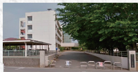
大平南中学校【徒歩約9分】