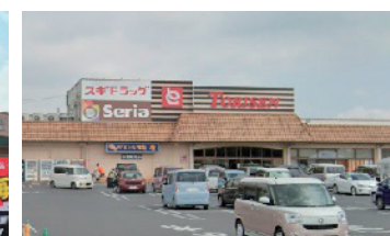
とりせん【徒歩約7分】