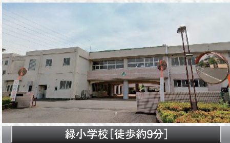
緑小学校【徒歩約9分】