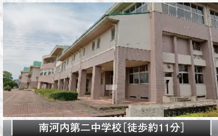
南河内第二中学校【徒歩約11分】