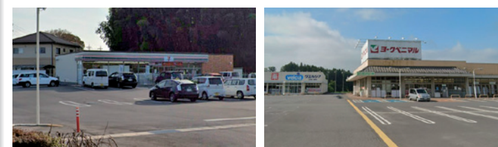
セブンイレブン [約2,500m]