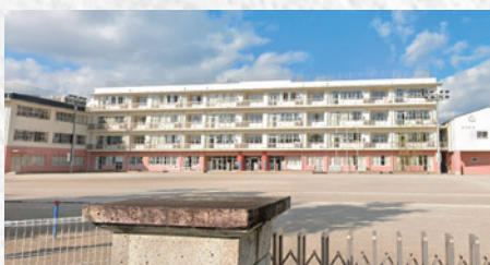
栃木中央小学校 [徒歩約12分]