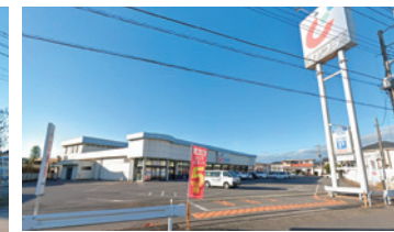
カワチ薬品 [徒歩約5分]