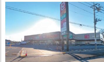
とりせん [徒歩約5分]